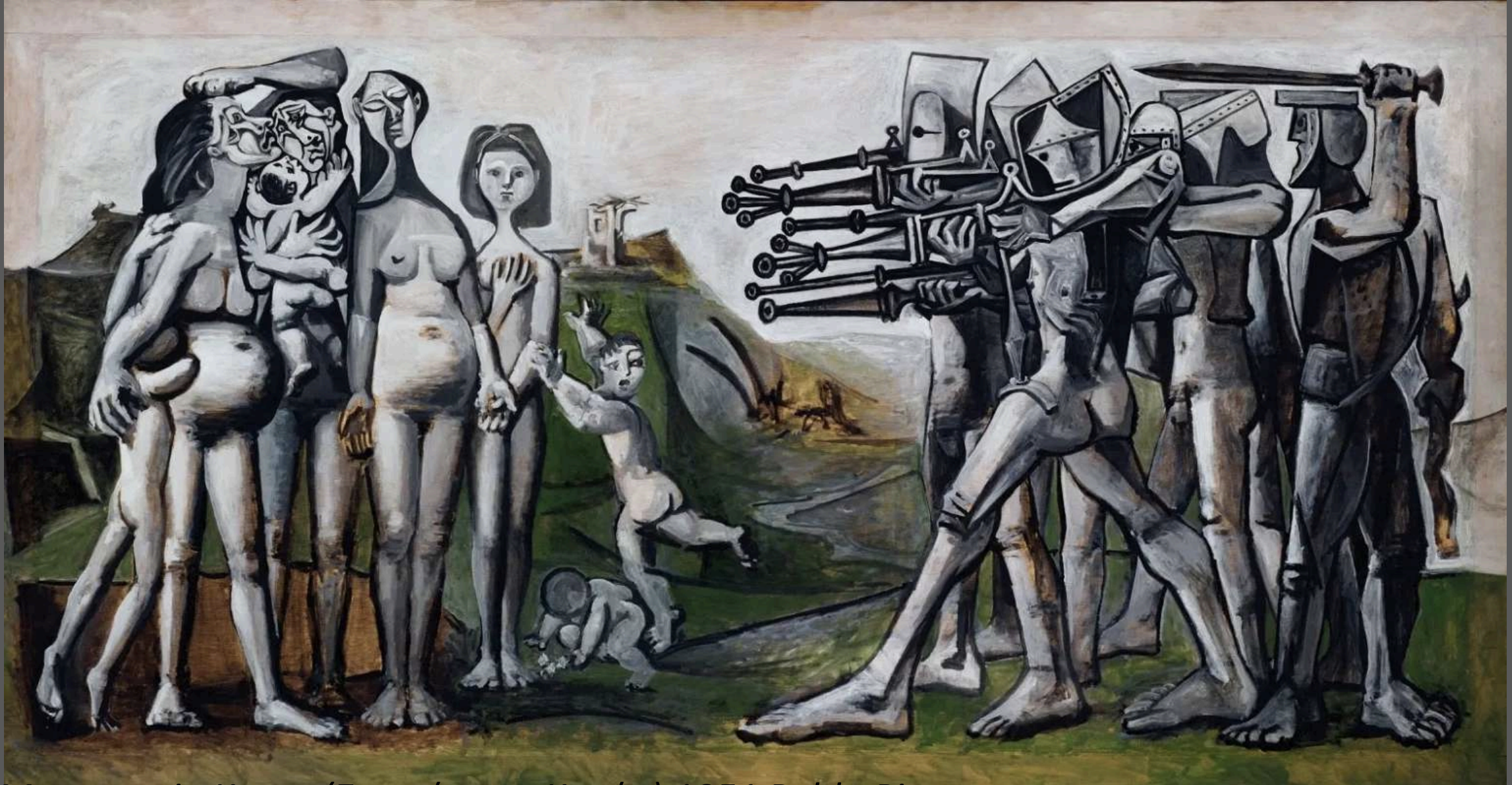
Massacre in Korea (Σφαγή στην Κορέα) 1951 Pablo Picasso